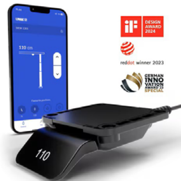
Bedienelement PRIME Steuerung über App möglich